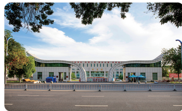
石河子大学中区南门